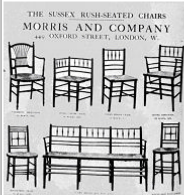
Una pagina del catalogo sedie Morris & CO, 1860

Esiste un forte legame tra l'opera di Henry Cole e quella di William Morris. Al di là del diverso atteggiamento nei confronti della produzione industriale, entrambi riconobbero gli stessi valori: l'amore per gli oggetti della vita quotidiana, le esigenze del più vasto pubblico, l'azione propagandistica e soprattutto la preferenza per le arti applicate.