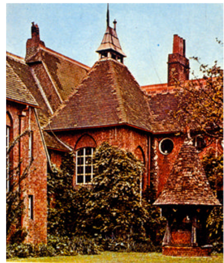
Philippe Webb, Red House, 1859 veduta angolare

Inoltre i suoi più immediati eredi, cioè la generazione nata intorno al 1850, aderirono ancor più esplicitamente alle condizioni del tempo: alla bottega artigiana sostituirono una rete di laboratori e organizzazioni produttive, ed ammisero esplicitamente la possibilità di avvalersi del lavoro delle macchine. La ricerca teorica ed estetica di Morris fu quindi il seme da cui, nell'ultimo decennio del secolo XIX, germogliarono le correnti artistiche moderniste.